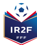
IR2F Nouvelle-Aquitaine ir2f@lfn.a.fff.fr

Retrouvez toutes les informations sur notre site internet lfn.a.fff.fr